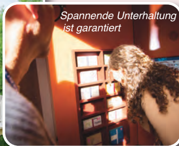
Spannende Unterhaltung ist garantiert