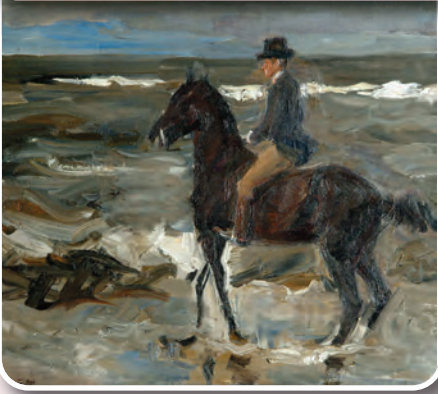
Foto (c) Max Liebermann, Le Cavalier sur la plage, 1904, Musée des Beaux-Arts de Liège/La Boverie —Ville de Liège.