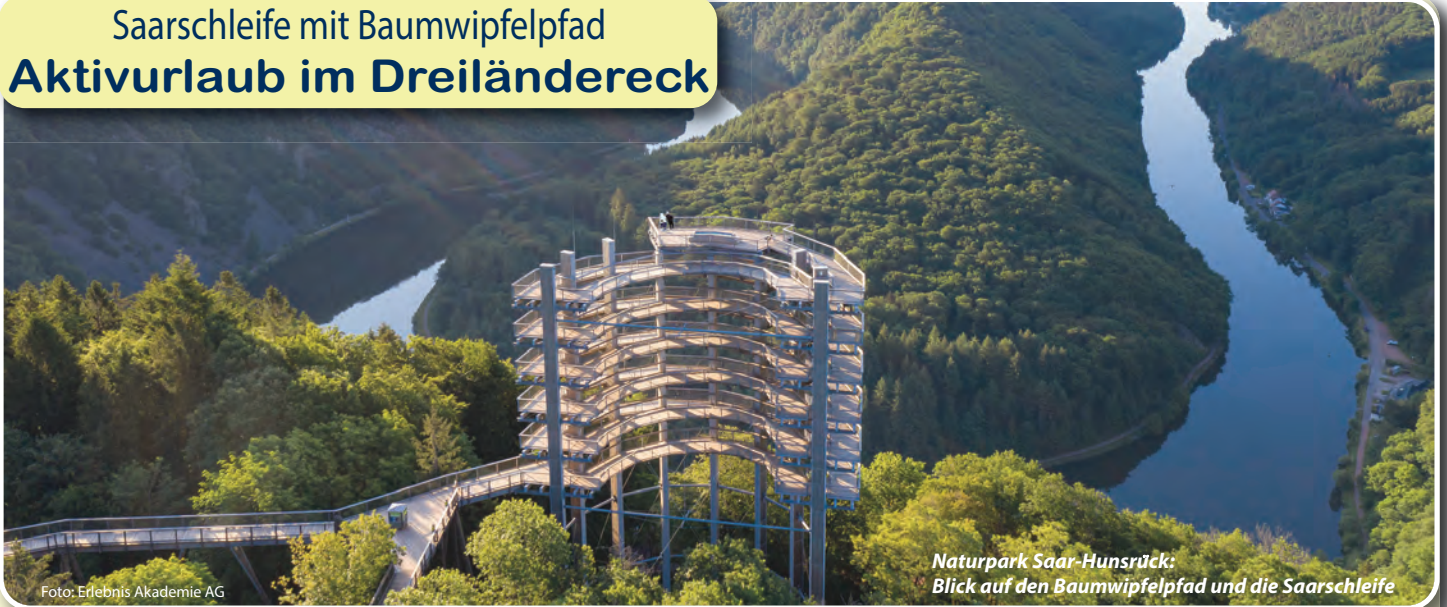
Naturpark Saar-Hunsrück: Blick auf den Baumwipfelpfad und die Saarschleife