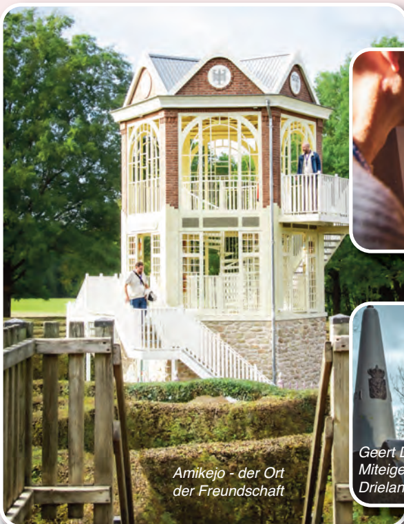
Amikejo - der Ort der Freundschaft

tickets online bestellen unter www.drielandenpunt.nl