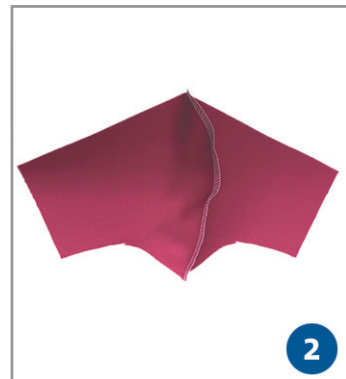
2. Je zwei Teile übereinanderlegen und an der Rundung zusammennähen sowie versäubern