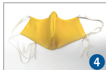
4. Bänder seitlich annähen und Seiten schließen