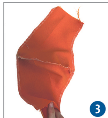
3. Die beiden Doppelteile rechts auf rechts legen, oben und unten zusammennähen, versäubern und anschließend umstülpen