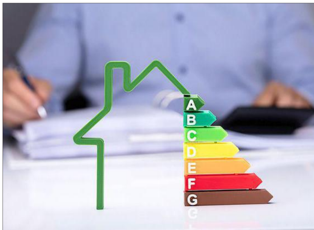
Zum finanziellen Handicap gerade beim Erwerb von Anwesen älteren Datums wird in der Zwischenzeit die erforderliche energetische Umrüstung, die eine Renovierung nicht selten erschwert.