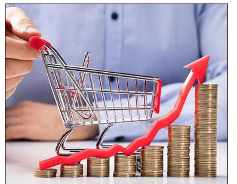
Die Inflation bleibt weiterhin eine gewichtige Bremse für die Konjunktur auf einem vorerst stagnierenden Markt.

Grundsätzlich jedoch bleibt eine (bittere) Erkenntnis: Der Weg zu Wohneigentum ist auch in Belgien holpriger geworden. Und es dürfte einige Zeit vergehen, bis das letzte Schlagloch wieder ausgebessert ist.