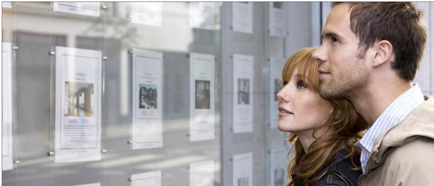
Nach „Jahren des Kaufrauschs“ verbleiben derzeit zahlreiche Angebote deutlich länger im Schaufenster, müssen Anbieter ihrer Preisvorstellungen nicht selten „nach unten“ revidieren.

In der Tat... Erst waren es die explodierenden Produktpreise „am Bau“. Dann kamen die Materialengpässe hinzu. Nachfolgend stand uns die Inflation ins Haus. Und nun scheint kein Ende der Zinsstei-